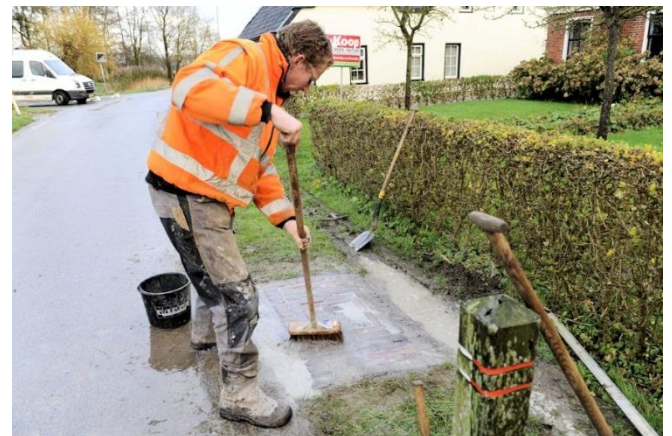
De laatste hand

Daarmee wordt nog meer recht gedaan aan de gedachte achter het project Stolpersteine.