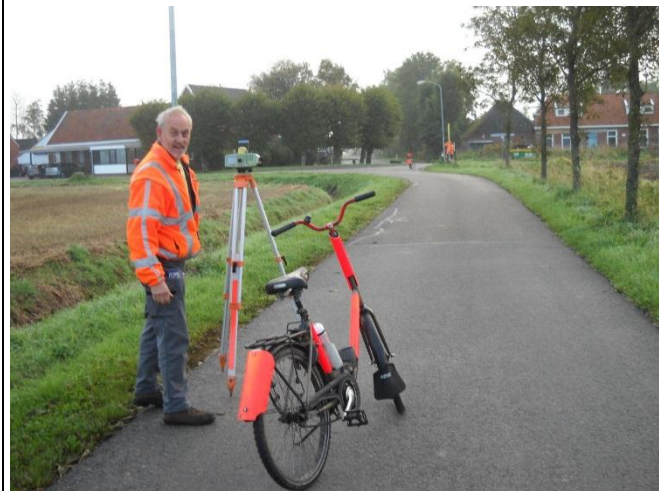
Mannen van Ingenieursbureau Mug meten in opdracht van de NAM de NAP-hoogte van zogeheten zwaartekrachtenpunten

Het NAP-net is op veel plekken terug te vinden in de vorm van bronzen boutjes in bijvoorbeeld gebouwen, met het opschrift NAP. Die 35.000 NAP-peilmerken zijn overigens door de onstabiele ondergrond ook niet altijd nauwkeurig en worden eens per tien jaar gecontroleerd aan de hand van van hoogte van 400 ondergrondse peilmerken die gefundeerd zijn op een zandlaag die bijna niet verzakt.