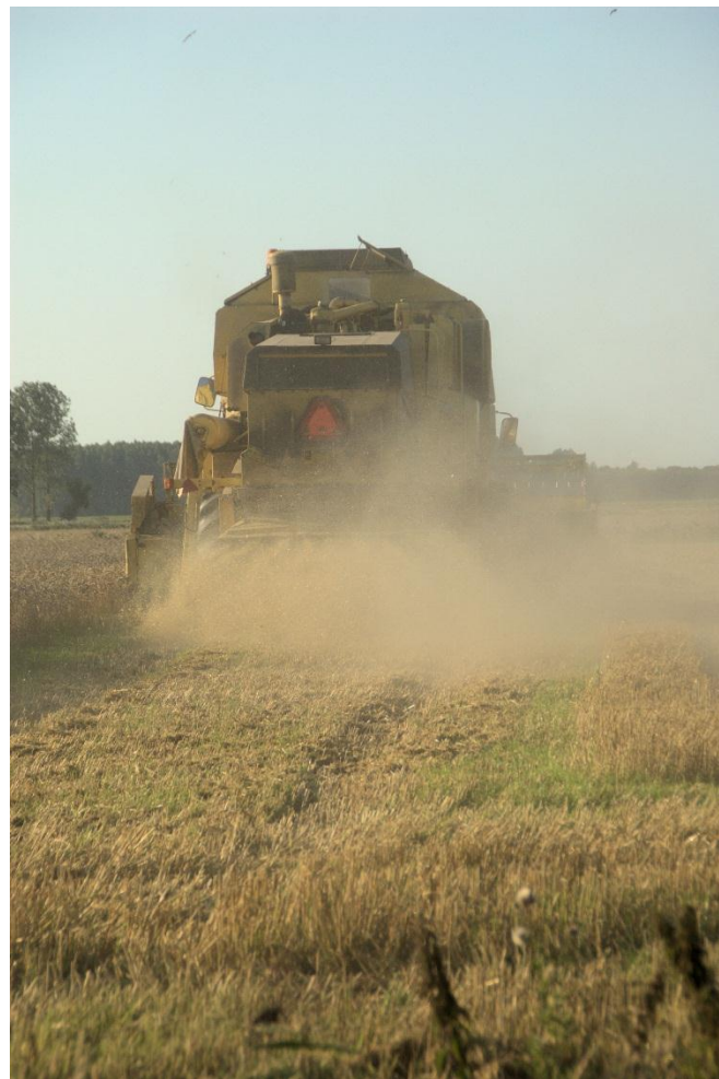
Droog in augustus

Een winter die pas ver in de lente eindigde, maar nauwelijks koud was te noemen en een herfst die doorging tot ver na 5 december met bovengemiddelde temperaturen: +/- 10° C.