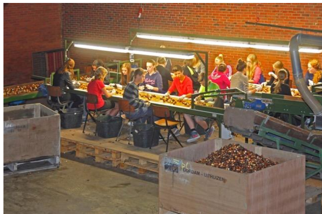
In de schuur van boerderij De Korenaar

Tussen half juli en half augustus vonden zo'n 50 scholieren vakantiewerk bij de Mts. Noordam