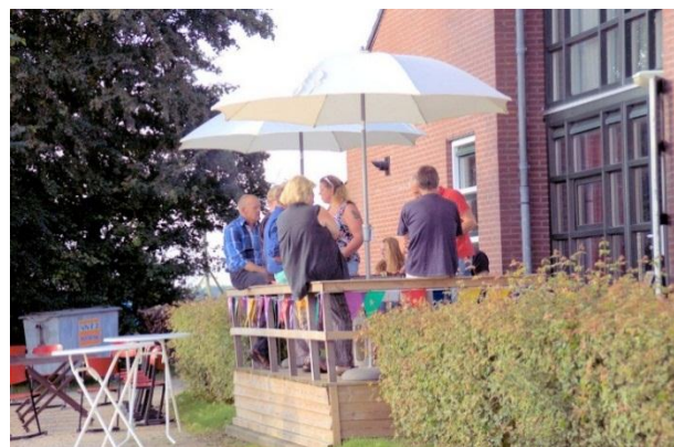
Het terras was in trek

Aan het einde van 2015 wenst de redactie alle lezers een goed en voorspoedig 2016. Een jaar waarvan wij hopen dat de wereld er wat vrediger uit zal komen te zien