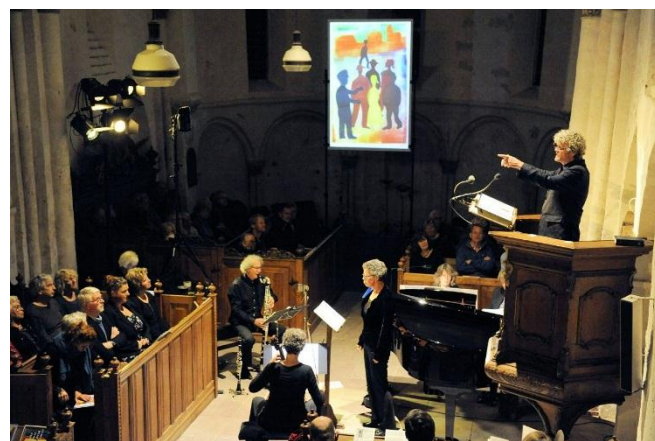
Tekst, muziek en beeld tijdens het Werkmanconcert

De musici gaven door hun fraaie uitvoering de muziek een extra dimensie mee. Soms fluisterstil (haast niet te geloven dat een basklarinet zó zacht kan klinken), soms groots en meeslepend, maar altijd passend bij de teksten en de beelden, waardoor muziek, tekst en beeld complementair werden en er gesproken kon worden van een totaalbeleving.