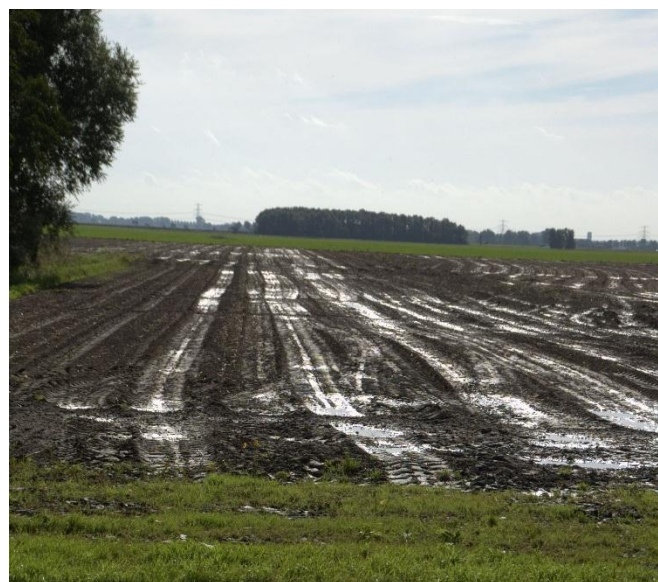
Nat in september