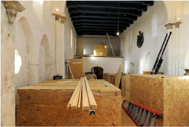
Banken en de preekstoel heel goed ingepakt

Op 22 februari is eindelijk een begin gemaakt met het herstel van de aardbevingschade aan de Nicolaaskerk. Tegelijkertijd wordt er regulier onderhoud gepleegd en worden dakgoten aangebracht om het vochtprobleem nog beter aan te pakken. Dit betekent ook dat de kerk ongeveer drie maanden gesloten zal zijn voor het publiek.