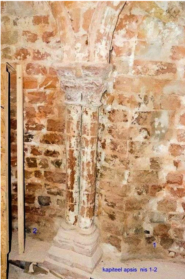
De kapitelen mooi in het zicht