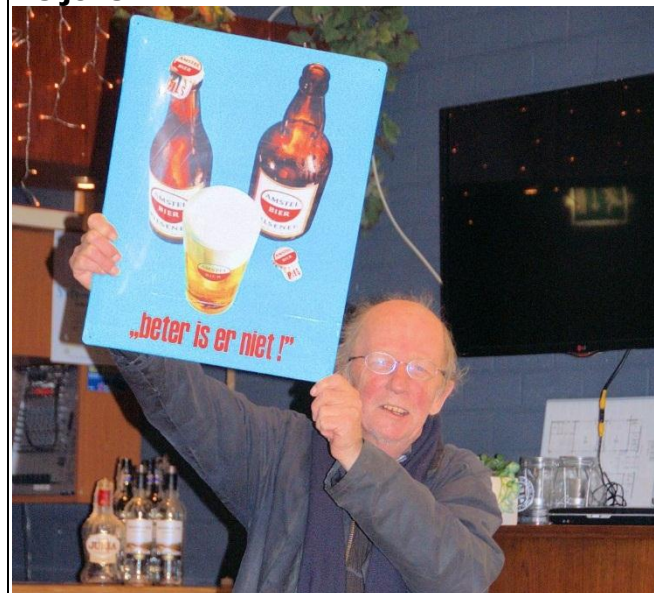
Bier is beter dan een joker

De joker is vorig jaar aan Geurt uitgereikt, maar hij betoogt dat dit een Limburgs en carnavalesk gebruik was, waarbij mensen belachelijk werden gemaakt en hij weigert daarom iemand anders aan te wijzen.. Daarmee valt de joker terug aan het bestuur, die volgend jaar de joker weer zal uitreiken.