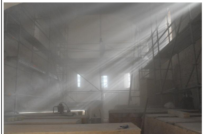
Stof! Goed te zien toen het zonnetje even doorbrak

Het pleisterwerk binnen is verwijderd waardoor ook de aanzetten van oude gewelven zichtbaar worden. Waarschijnlijk is de hele kerk overwelfd geweest, met in totaal vier gewelven. Ook te zien is dat de westelijke traveeën opnieuw zijn opgebouwd. In elk geval na dat de gewelven waren ingestort / gesloopt, want westelijk van de overgang ontbreekt de gewelfaanzet. Het verwijderen van het pleisterwerk ging met een ongelooflijke hoeveelheid stof gepaard.