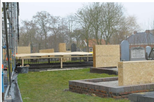
Ook sommige graven buiten zijn ingepakt , tegen vallen puin en ander mogelijkheid