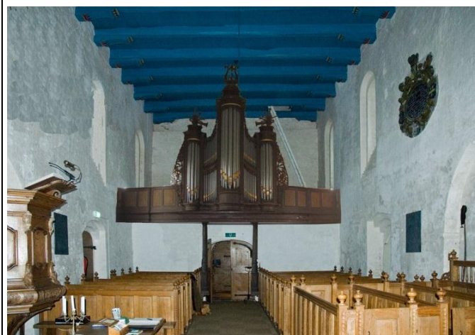
Zo zal het er ongeveer uit gaan zien

De ontwikkelingen rondom het orgel zijn ook in een stroomversnelling terechtgekomen. Toen bekend werd dat er voor de subsidieregeling voor orgels nog maar weinig aanmeldingen waren, is besloten om te proberen 'ons' orgel nog mee te laten liften. Maar dat betekende dat de subsidieaanvraag vóór 1 april ingediend moest zijn.