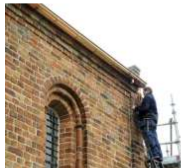
Werk aan de goot

Inmiddels is alles weer weg gepleisterd. Maar we hebben de foto's nog! In tegenstelling tot de pleisterlaag die bij de grote restauratie in 1950-1952 op de muren werd aangebracht, is de nieuwe pleisterlaag ademend. Het vocht wordt niet meer opgesloten in de muren, wat mede een oorzaak was van het vochtprobleem in de kerk. De nieuwe pleisterlaag is anders van structuur en daarmee moet dát probleem in ieder geval zijn opgelost.