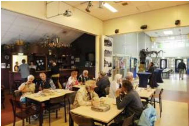
Gezellige drukte in Lutje Brussel en de school

Het dorps huis was dus open, bevrouwd en bemand door vrijwilligers. De loop zat er al vroeg in, zowel voor de quilts als voor de koffie (desgewenst met gebak) broodjes, soep, kroketten en natuurlijk de sanitaire stop.