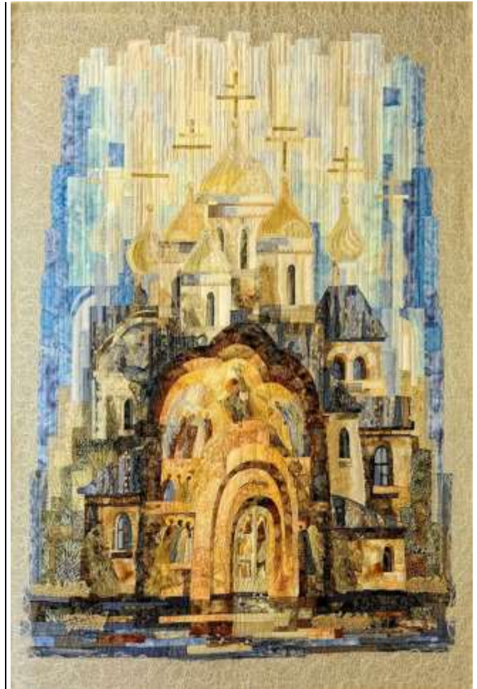
Artquilt van Irina Voronin

Het festival trok niet alleen duizenden bezoekers uit heel Nederland, maar ook velen uit het buitenland, waaronder een bus vol uit België. In het Openluchtmuseum in Warffum blijven de quilts van de expositie "Van Textiel tot Tyak", die deel uitmaakten van het festival, tot en met 28 augustus hangen.