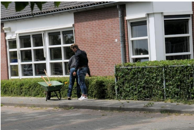
Snoeien van de heg