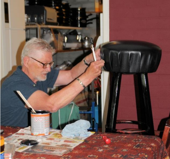
Het opknappen van een barkruk