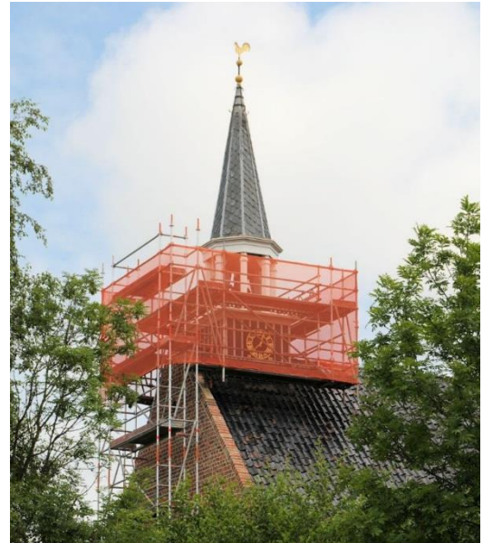
Kerk (weer) in de steigers

Vorige week is begonnen met het schilderwerk aan de dakruiter. De steigers werden vrijdag 8 juli opgebouwd en de maandag daarna kon het schilderwerk beginnen. Een weekje, was gepland. Maar zoals dat gaat: soms zit het mee, soms zit het tegen. En in dit geval zat het tegen. Behóórlijk tegen. Onder het ogenschijnlijk in goede staat verkerende verfwerk bevond zich een hoop rottigheid. Letterlijk! (Zie foto.) Onmiddellijke actie was vereist, niet in de laatste plaats omdat ook één van de klokkenstoelpoten is aangetast.