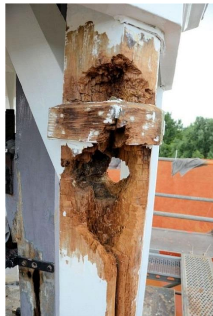
Zwaar verrotte paal van de dakruiter