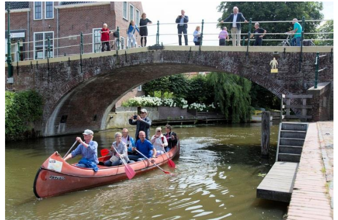
Met kano's kijken vanaf het water

Het gezelschap was getuige van de onthulling van het bouwboard voor de nieuwe, gasloze wijk Munster.