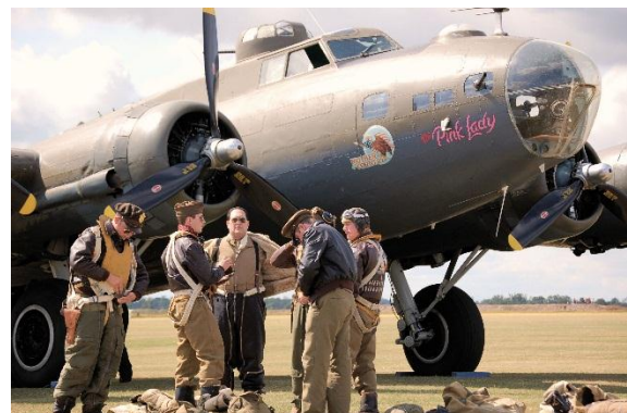
Bommenwerper (B-17) met bemanning