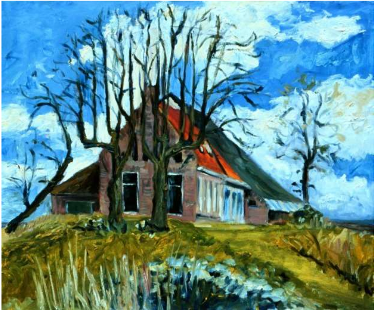
De kooiplaats geschilderd door Ruth Bugel

© 2016 Jan Pieter de Groot Tiros 6 9602 WG HOOGEZAND